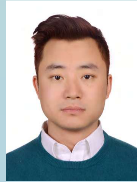
조니 푸 | 중국